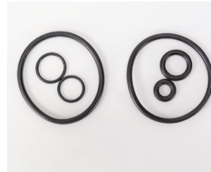
Resim 2: Solda OX 183/5D'nin ince contaları, sağda OX 183/5D1'in kalın contaları