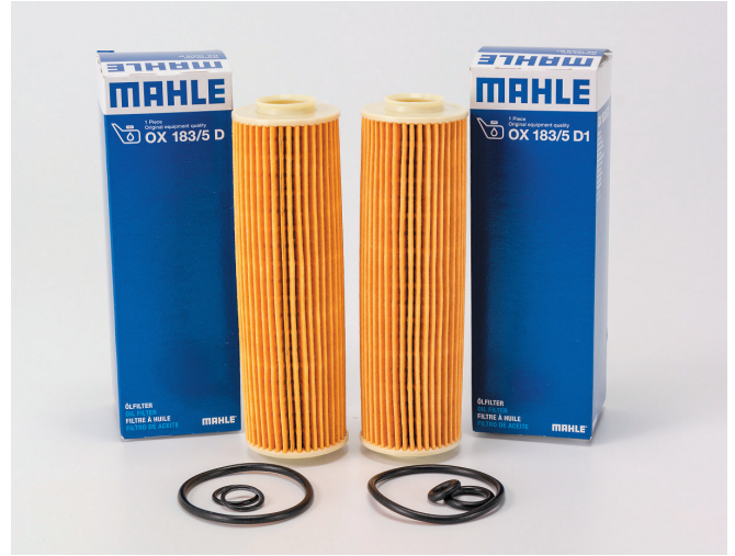
Resim 1: İlk bakışta, iki model de aynı gibi görünmektedir

Çok kalın contalar çoğu zaman ya hiç takılamaz veya sadece çok fazla çaba harcanarak takılabilir; bu durumda yağ filtresi gövde muhafazası kapağına ait mandrelin kırılması ve bu yüzden komple değiştirilmek zorunda kalınması riski vardır.