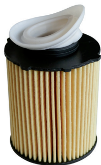
Рисунок 2: OX 982 D с оторванным антидренажным клапаном

Однако при замене картриджа масляного фильтра антидренажный клапан может оторваться от фильтра, оставшись к корпусу фильтра (в двигателе). Если этого не заметить, это может привести к тяжелым повреждениям двигателя.