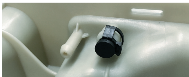
Ilustracja 3: W przypadku normy EURO 4 i 5 przyłącze trzeba zabezpieczyć zaślepką