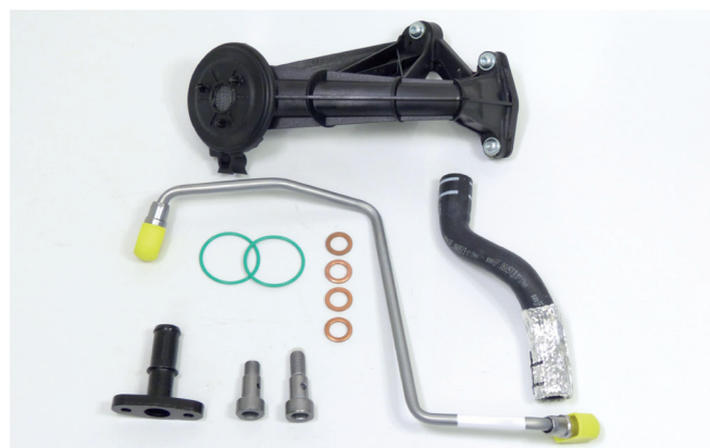
Ilustracja 2: 039 TK17308 010

W związku z powyższym korzystanie z prawidłowego zestawu montażowego jest bezwzględnie konieczne.