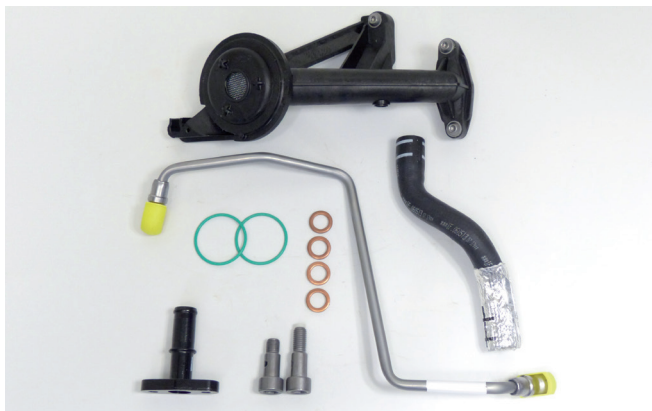
Ilustracja 1: 039 TK17308 000